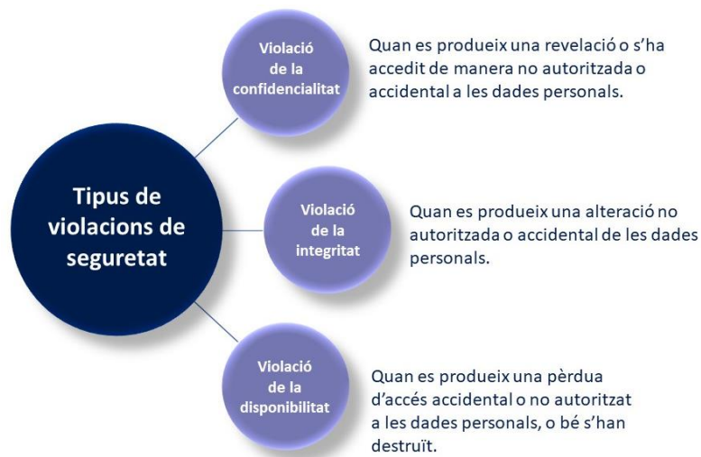
Imatge 1. Tipus de violacions de seguretat